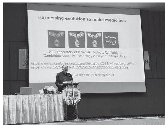
2018年ノーベル化学賞受賞Gregory Winter博士のご講演