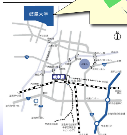
-岐阜大学へのアクセス-