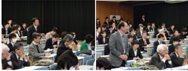
講師と会場との熱心な質疑応答