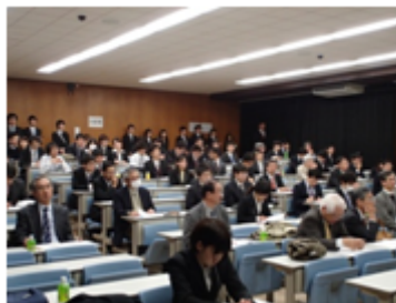
講演を熱心に聞き入る参加者