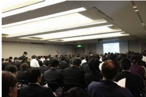
<一般講演会場にて>