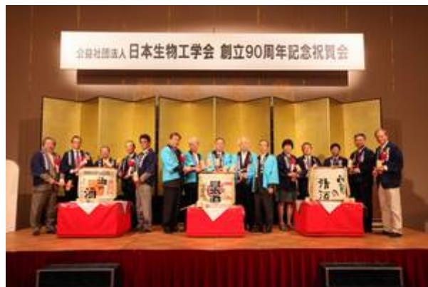
記念祝賀会・鏡割り