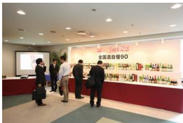
<特別展示会場にて>