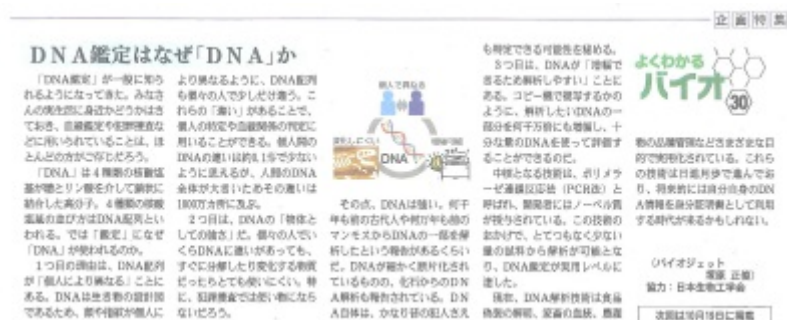
Fuji Sankei Business i. 2016年9月21日掲載