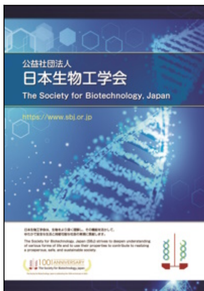
SBJ brochure (PDF 4.8MB)