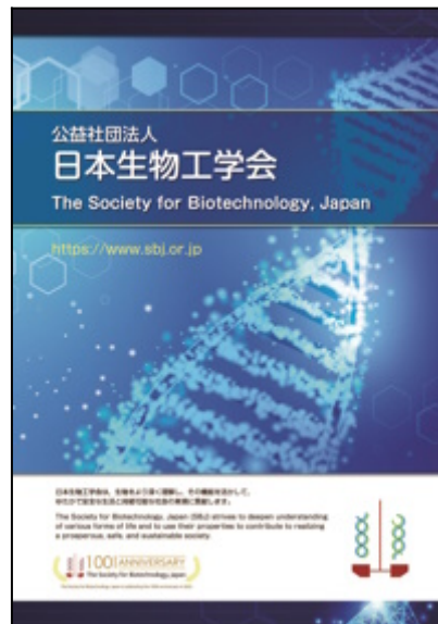
SBJ brochure (PDF 4.8MB)