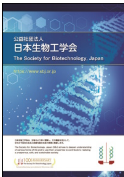
SBJ brochure (PDF 4.8MB)