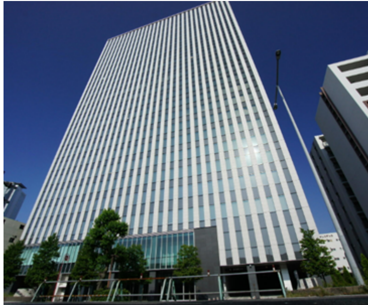
支部例会会場 プライムセントラルタワー 13階 第1+第2会議室